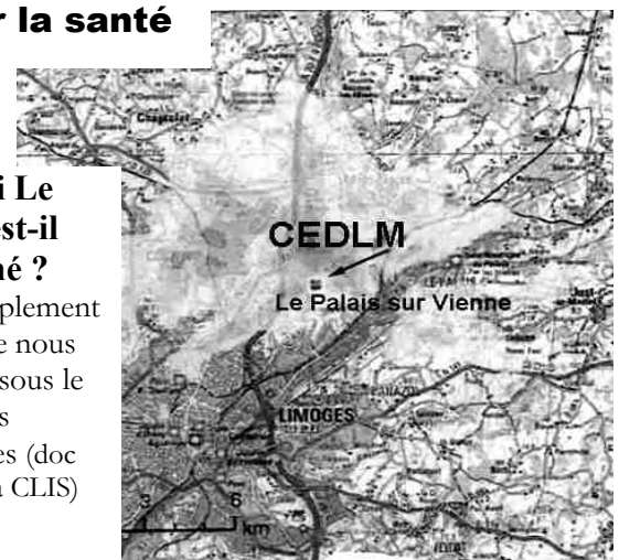
les retombées des rejets dans l'air

Tout simplement parce que nous sommes sous le nuage des retombées (doc fourni à la CLIS)