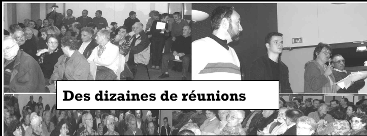
Des dizaines de réunions

Association d'usagers et d'environnement du Palais sur Vienne - (loi 1901) - Membre de "Sources et rivières"