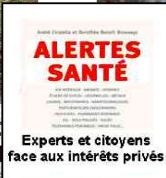
Experts et citoyens face aux intérêts privés