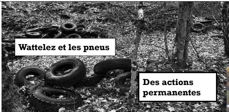
Wattelez et les pneus