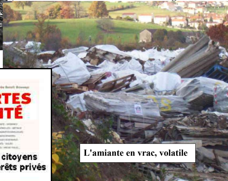
L'amiante en vrac, volatile