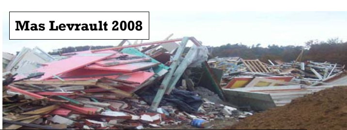
Mas Levrault 2008